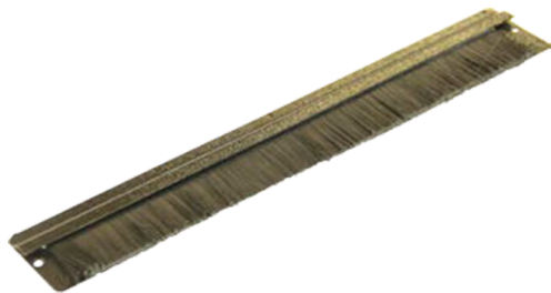
Щеточный ввод на одну щетку