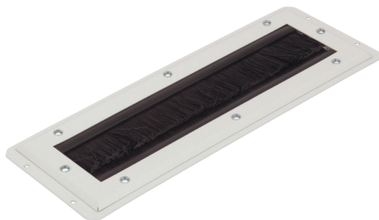
Щеточный ввод на две щетки